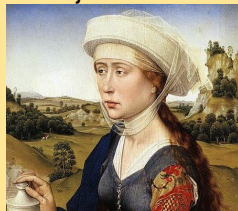
Jan v. Brabant College

Schilderkunst in Brussel v.d. Weijden 1450-1520.